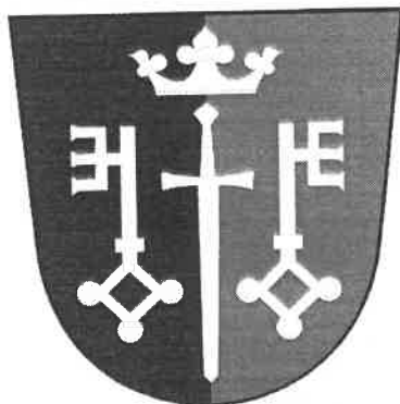
Znak Českých Petrovic