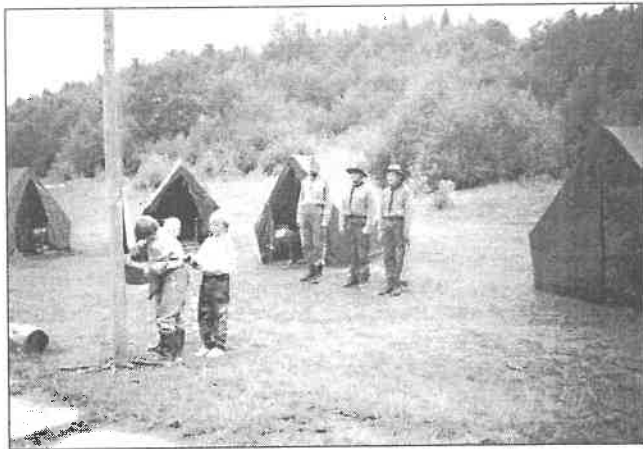
Vstýčování vlajky ve skautském táboře Václavova seč