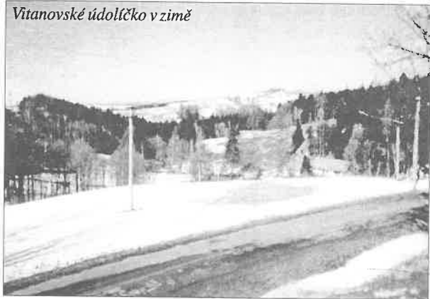
Vitanovské údolíčko v zimě