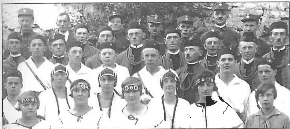
Někteří z těchto lidí mohli být pamětníky založení Sokola v roce 1909 – mnohé z nich dobře pamatujeme.