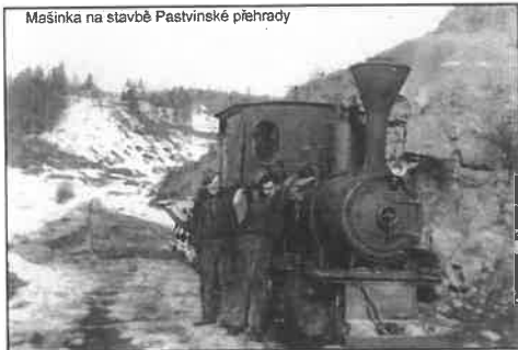
Mašinka na stavbě Pastvinské přehrady

A tak jsme mohli vláček slyšet pouze výjimečně v zimě, když byla zamrzlá řeka a panovalo úplné ticho, z Mezilesí nebo z Rokytnice. Koleje ale v Klášterci i Pastvinách byly. Správněji kolejničky na pilách, v lomě, ale také v údolí pastvinské přehrady, kde parní mašinka přepravovala z lomu