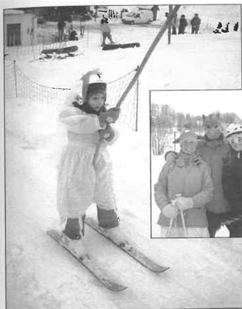
Foto z karnevalu pořádaného SKI klubem Pastviny na sjezdovce v Pastvinách 28. února 2009