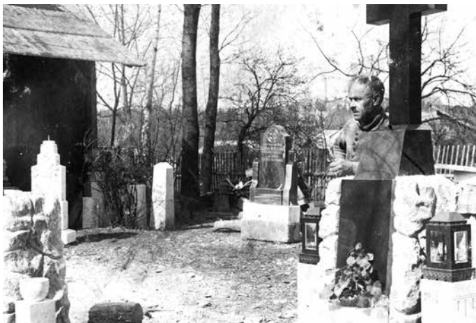
kamenická dílna v Žamberku u kostela