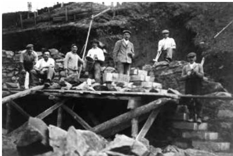
výstavba opěrné zdi, právě vyrůstají schody do tzv. svobodárny